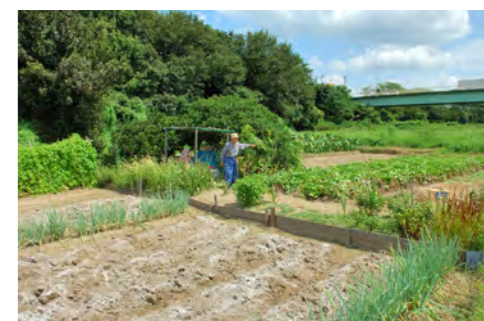
6. 高水敷の畑：庄内川開墾共同組合