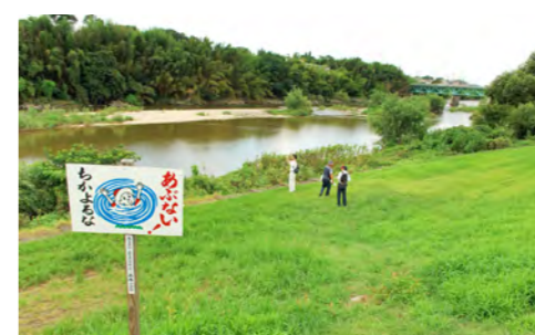
3. よい子は川で遊ばない？