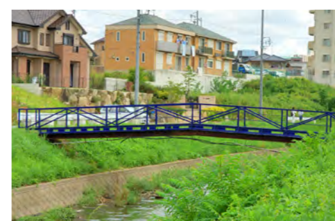
7. 新繁田川に架かるシンプルな橋