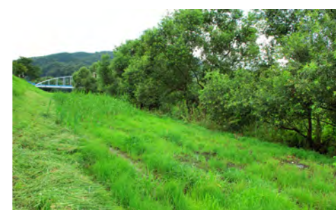
4. 湧き水がしみ出している