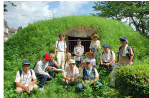
1. 高蔵寺第3号古墳（7世紀）