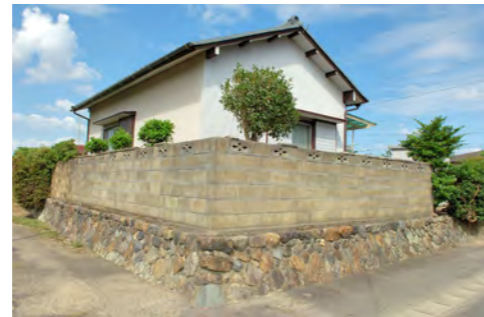
15. 桜佐の水屋：盛土して水害を軽減する