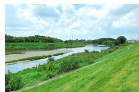
8. 大留橋上流：名古屋駅タワーが見える