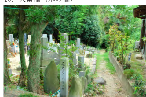
12. 大日の渡し跡 / みたらしの水