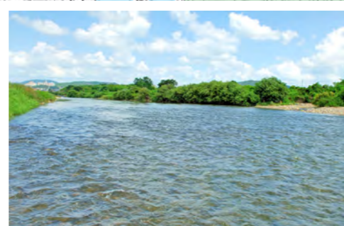
12. 野添川合流点（上流方向）