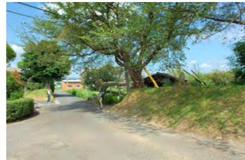
15. 桜佐のヨゲ堤（輪中）と水神様