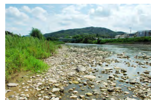
5. 新東谷橋上流：東谷山が見える