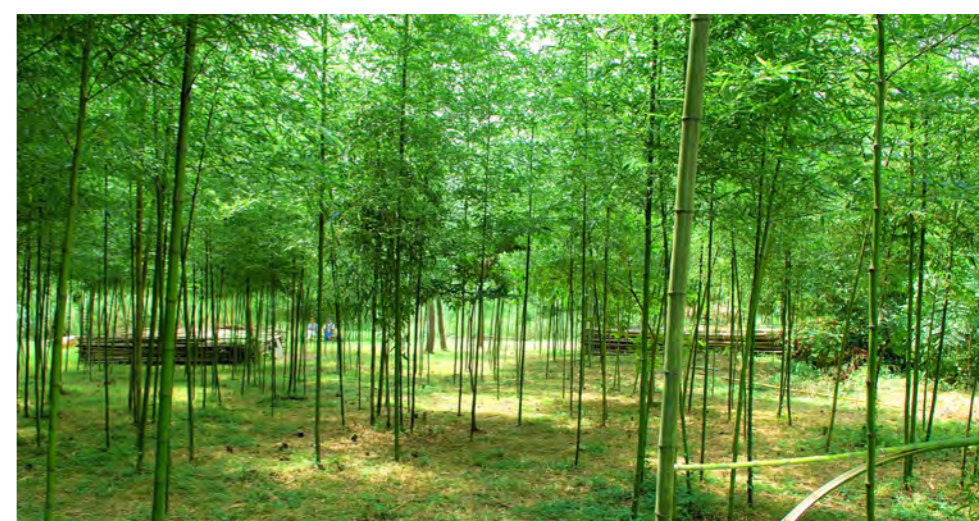
11. 志段味ビオトープ：竹林の手入れがなされ気持ちのよい空間になった