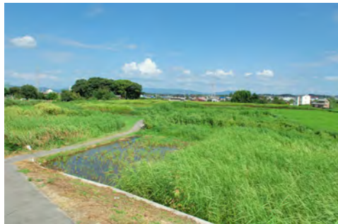
16. 桜佐の集落景観と八龍社の鎮守の森